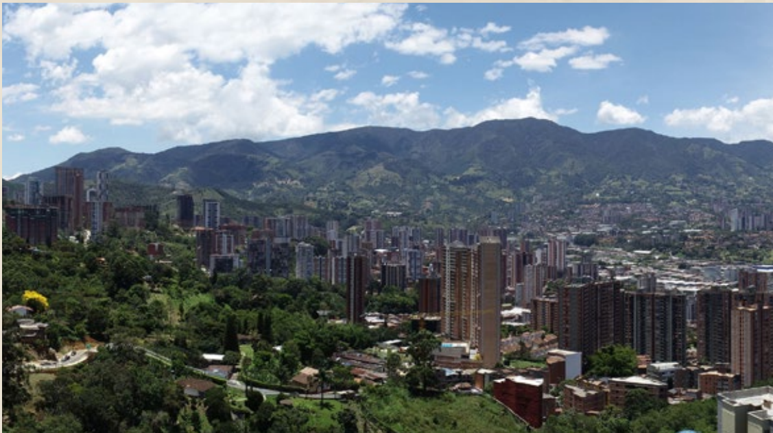
—● VISTA SUR