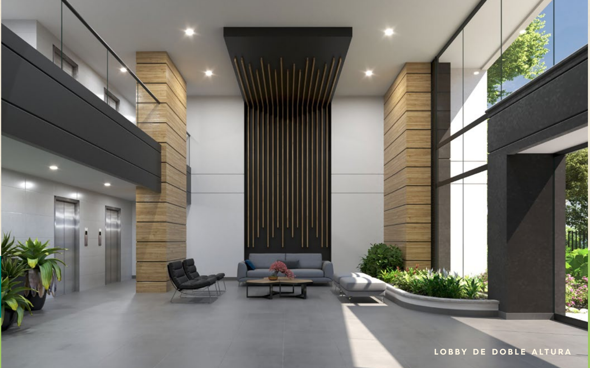
LOBBY DE DOBLE ALTURA