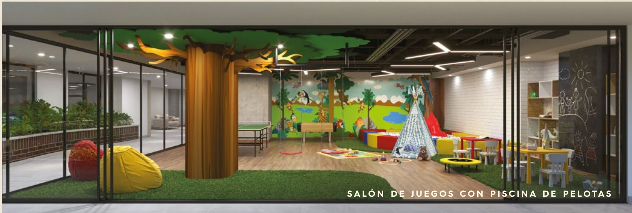
SALÓN DE JUEGOS CON PISCINA DE PELOTAS