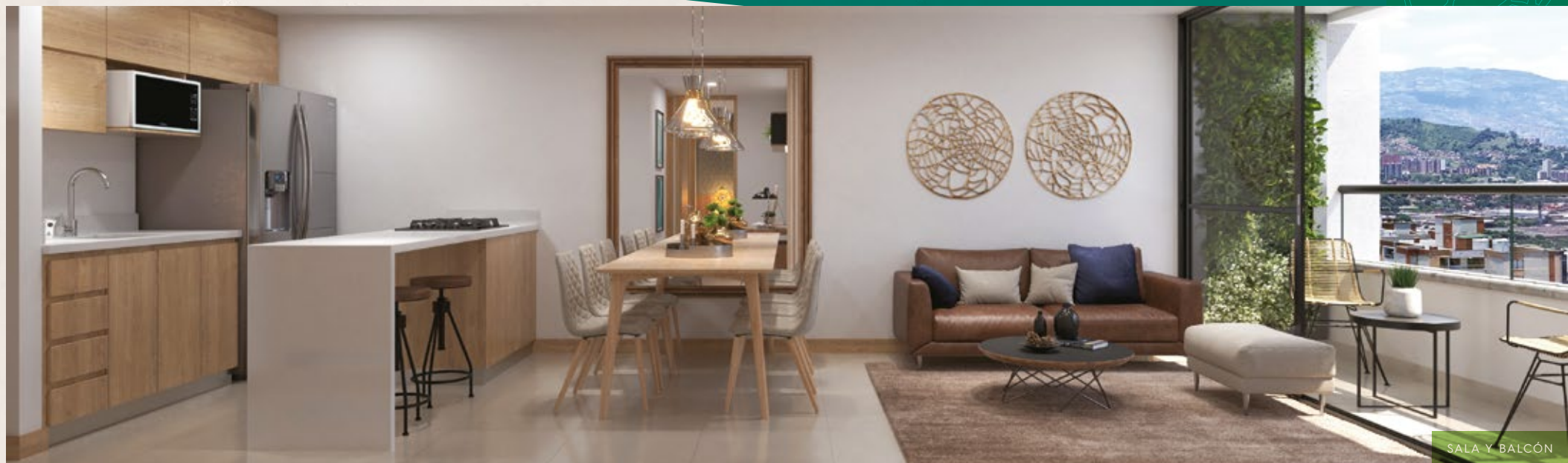
SALA Y BALCÓN