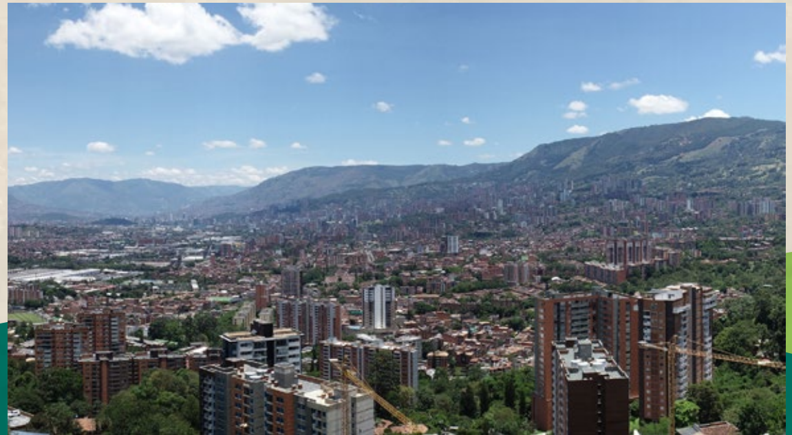
VISTA NORTE —●