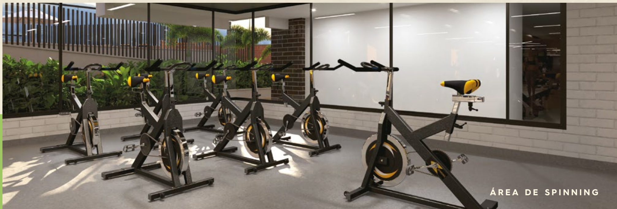
ÁREA DE SPINNING