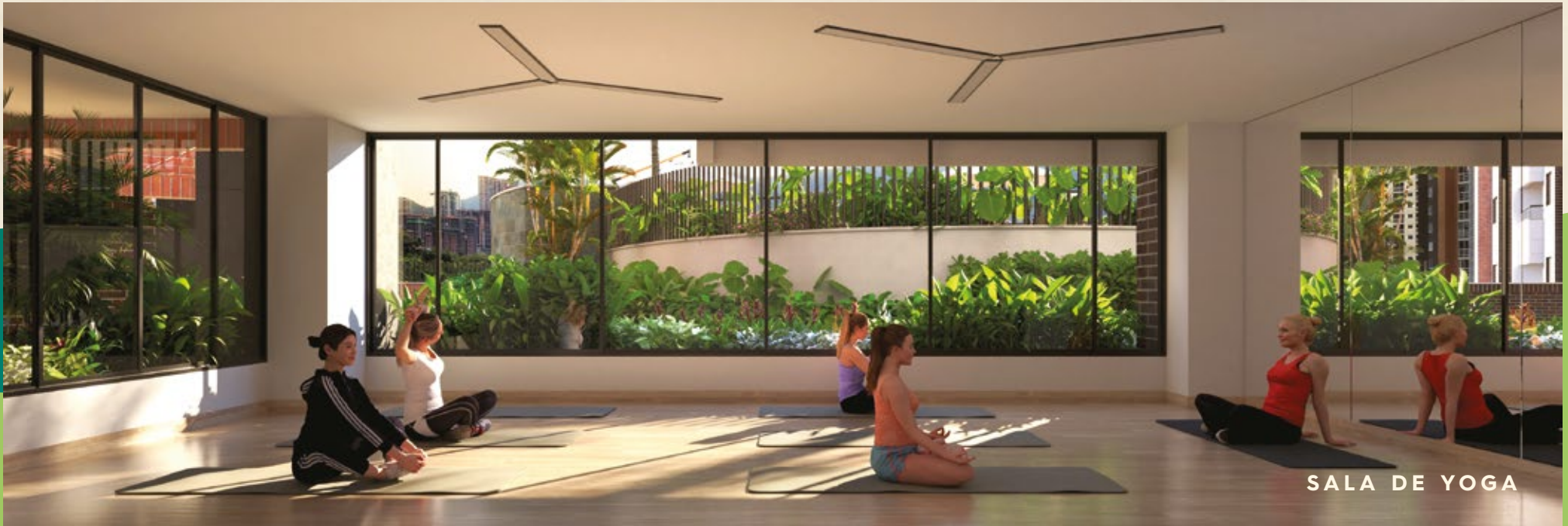
SALA DE YOGA