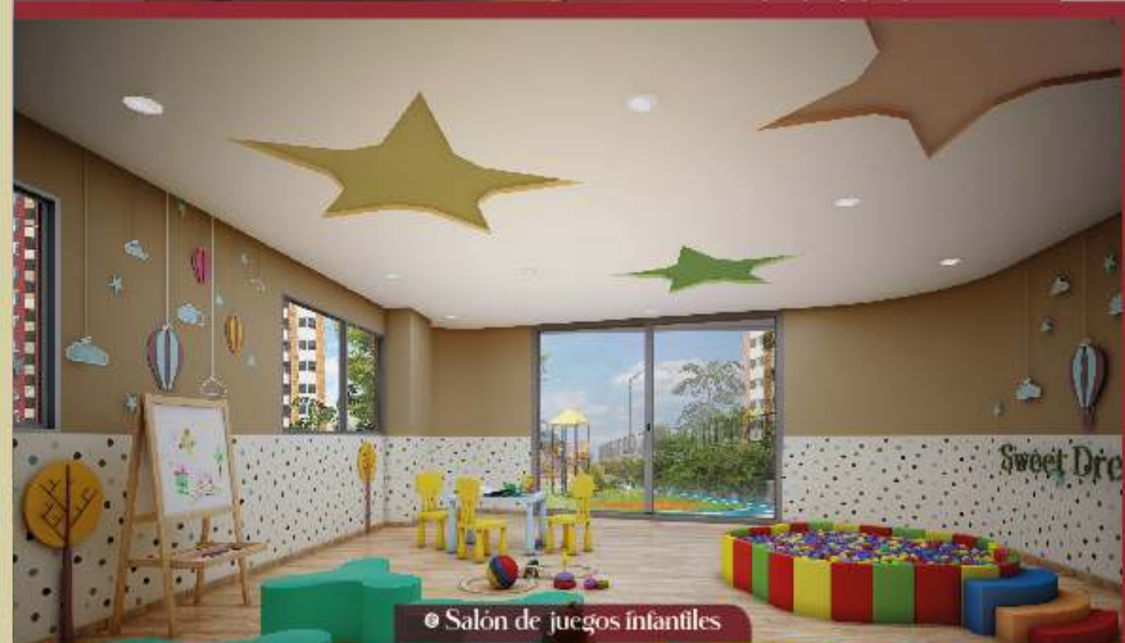
• Sal3n de juegos infantiles