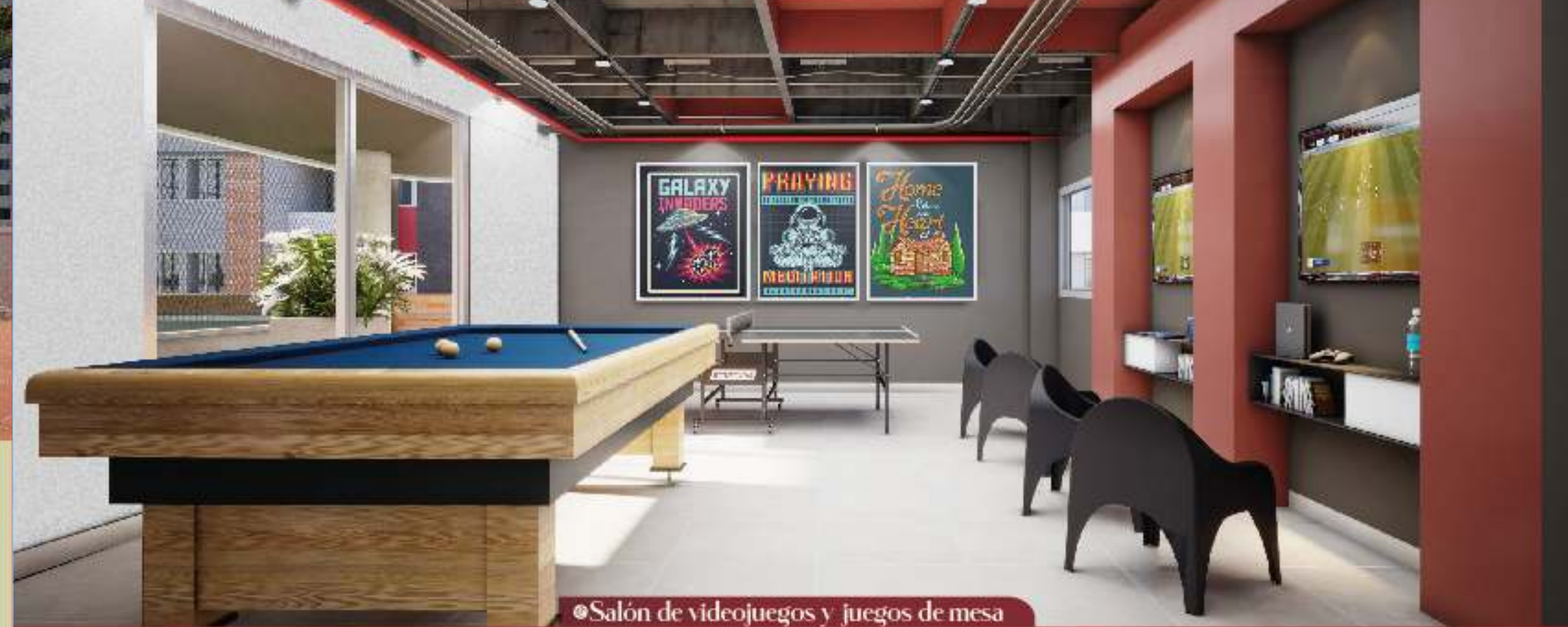
• Sal3n de videojuegos y juegos de mesa