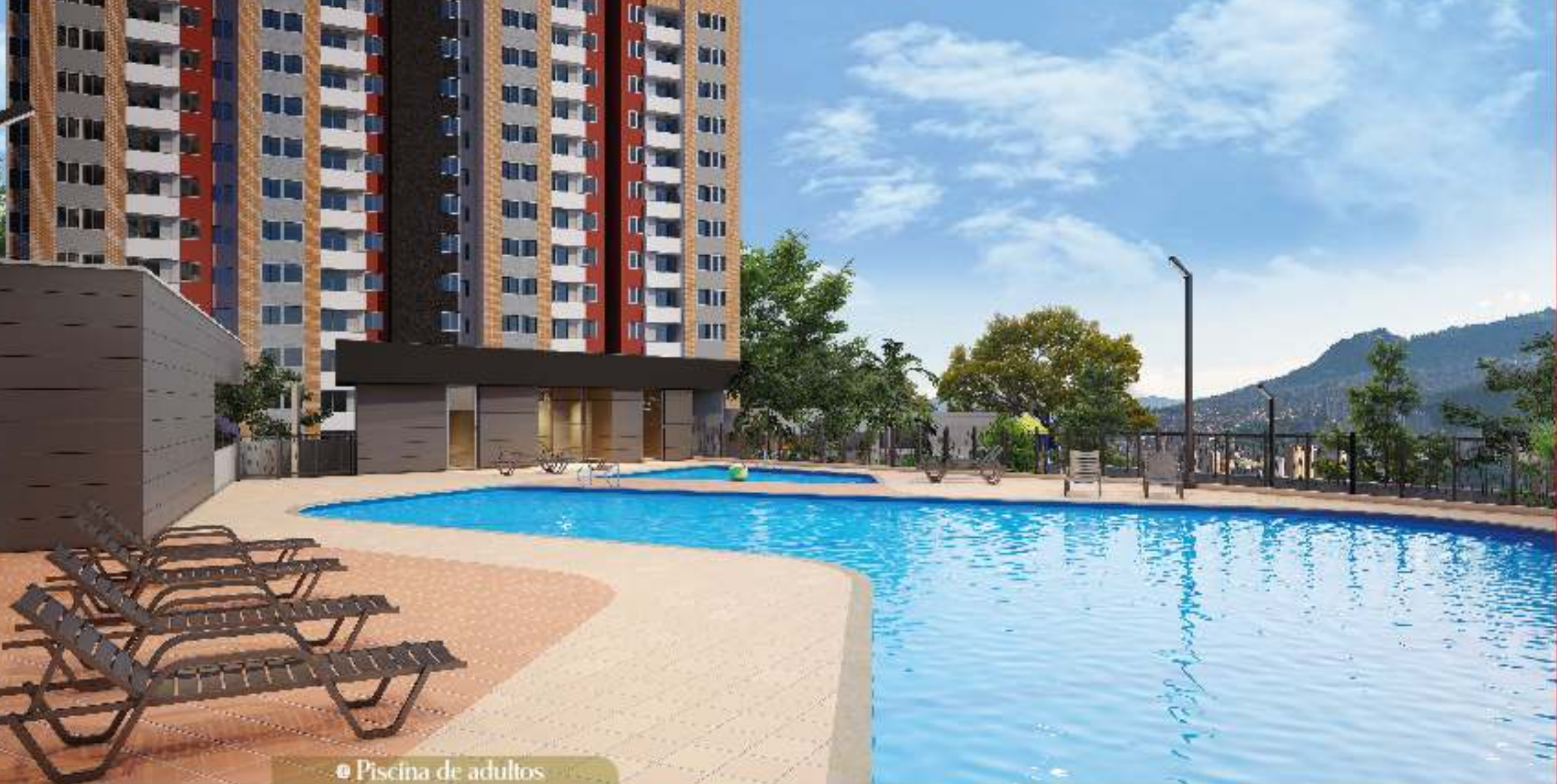
● Piscina de adultos