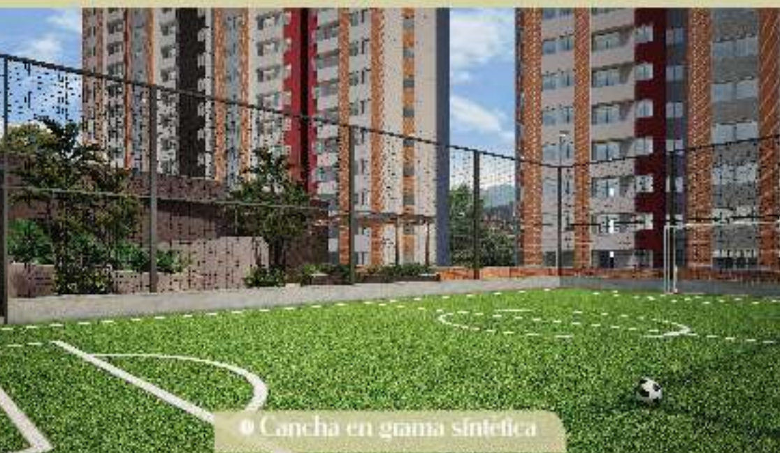
● Cancha en grama sintética