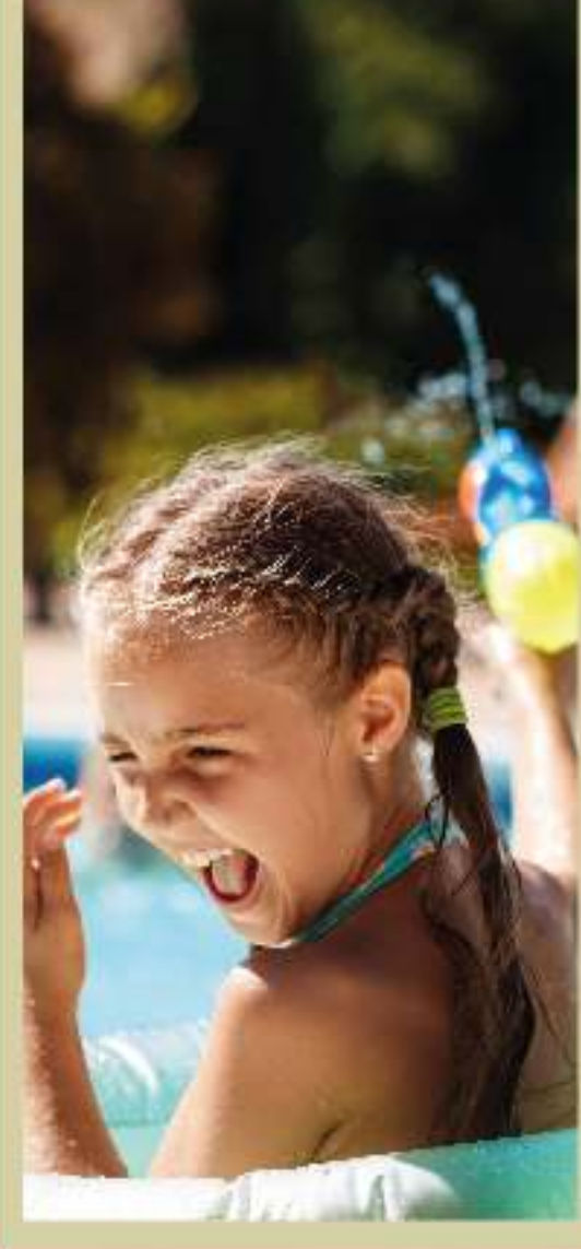
● Juegos infantiles