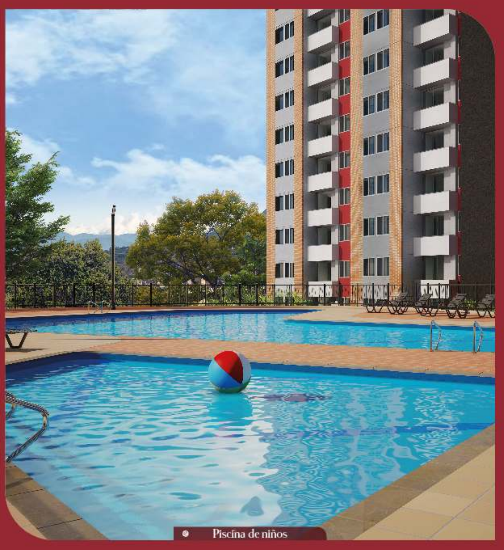
● Piscina de niños