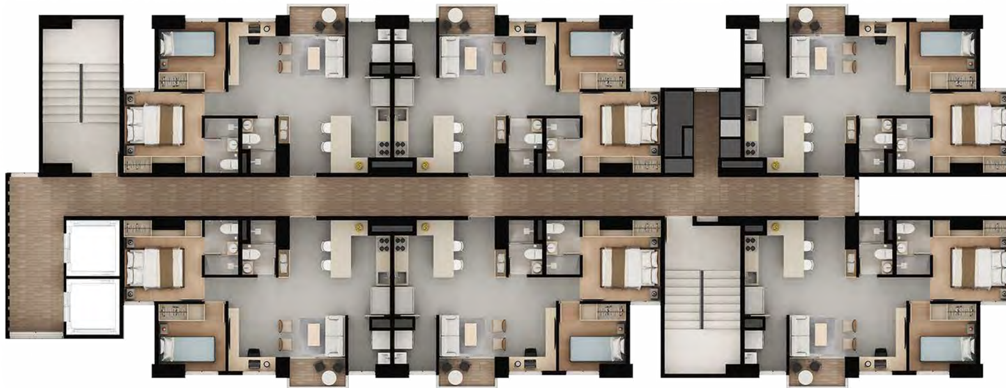
Apto Tipo A Área construida 52.50 m 2 *Área privada de 46 m 2