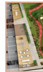
Salón adultos, Terraza, Salón social