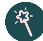
Parque de hadas