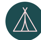
Zona de picnic