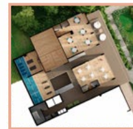
Squash, Salón social, Guardería, Gimnasio