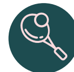
Cancha de squash