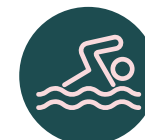
Piscina adultos y niños