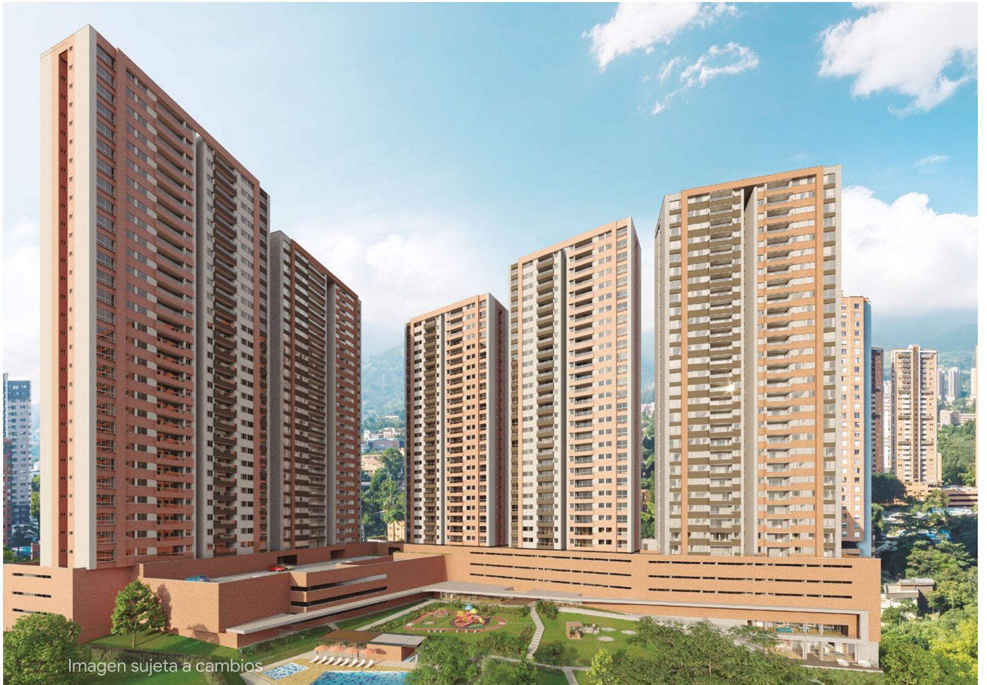
Imagen sujeta a cambios