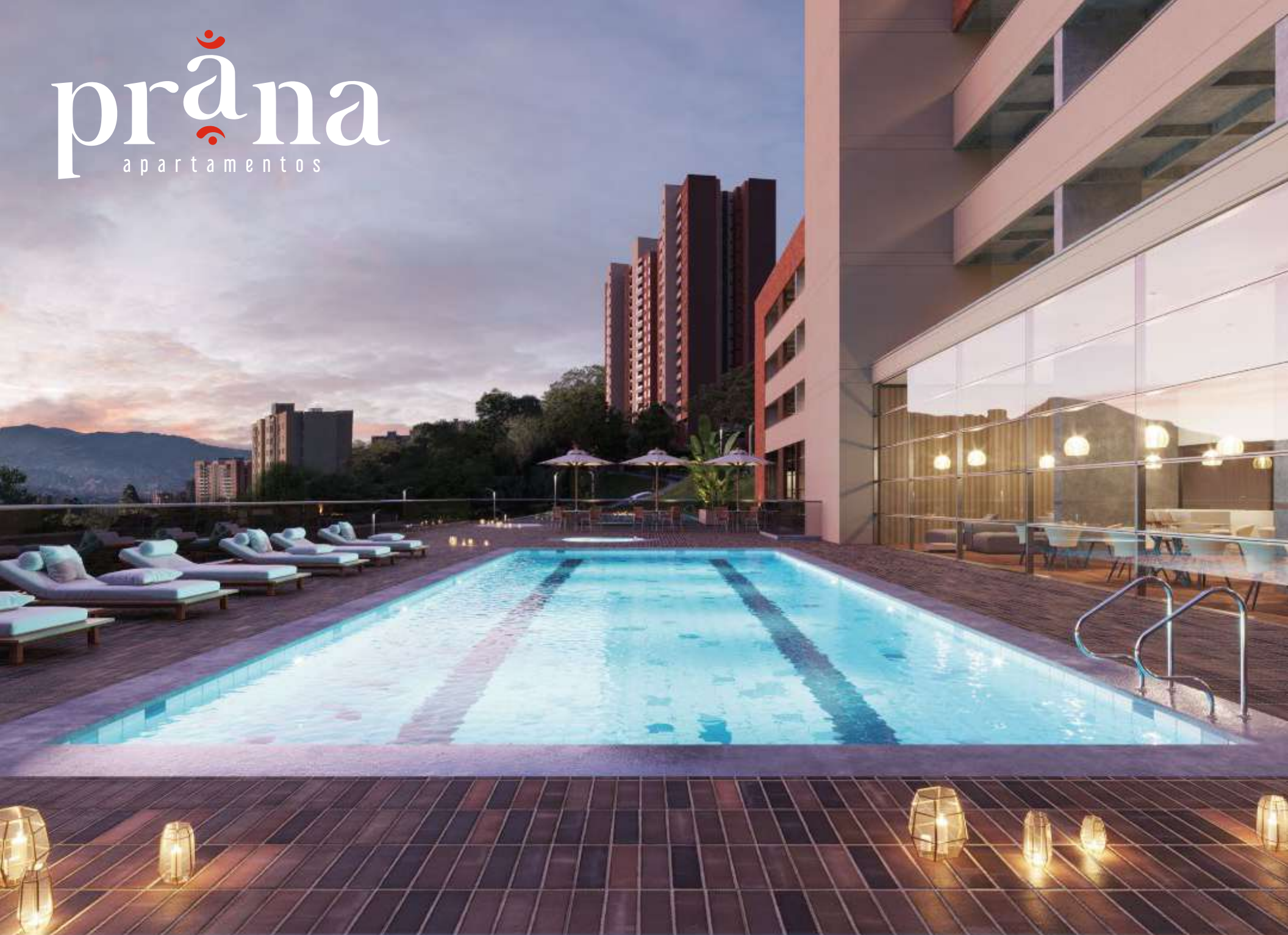
Imagen sujeta a cambios. Fecha de publicación abril 2023.