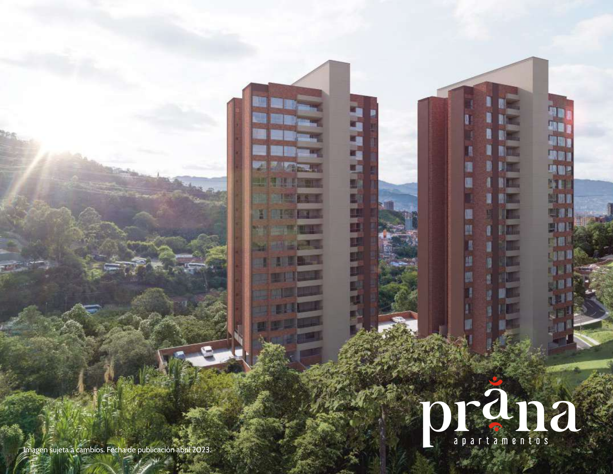
Imagen sujeta a cambios. Fecha de publicación abril 2023.