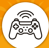
Sala de TV y video