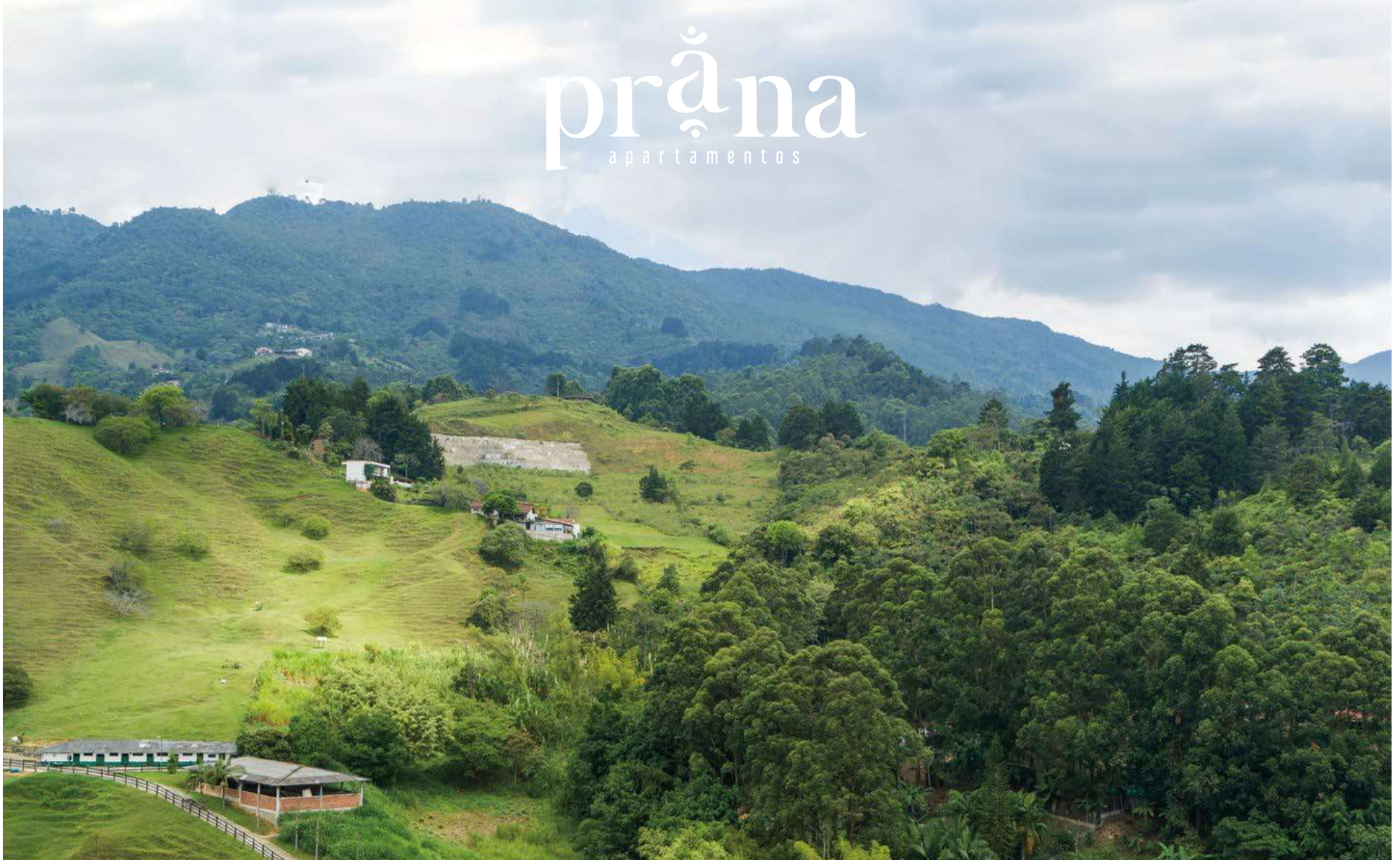
- Vista Suroriente -