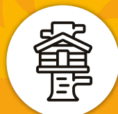
Salón niños con casa en el árbol