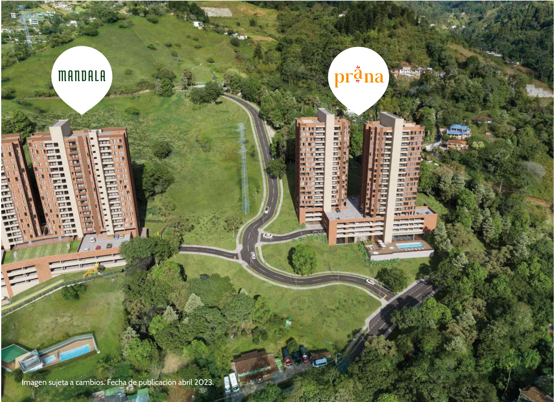
Imagen sujeta a cambios. Fecha de publicación abril 2023.