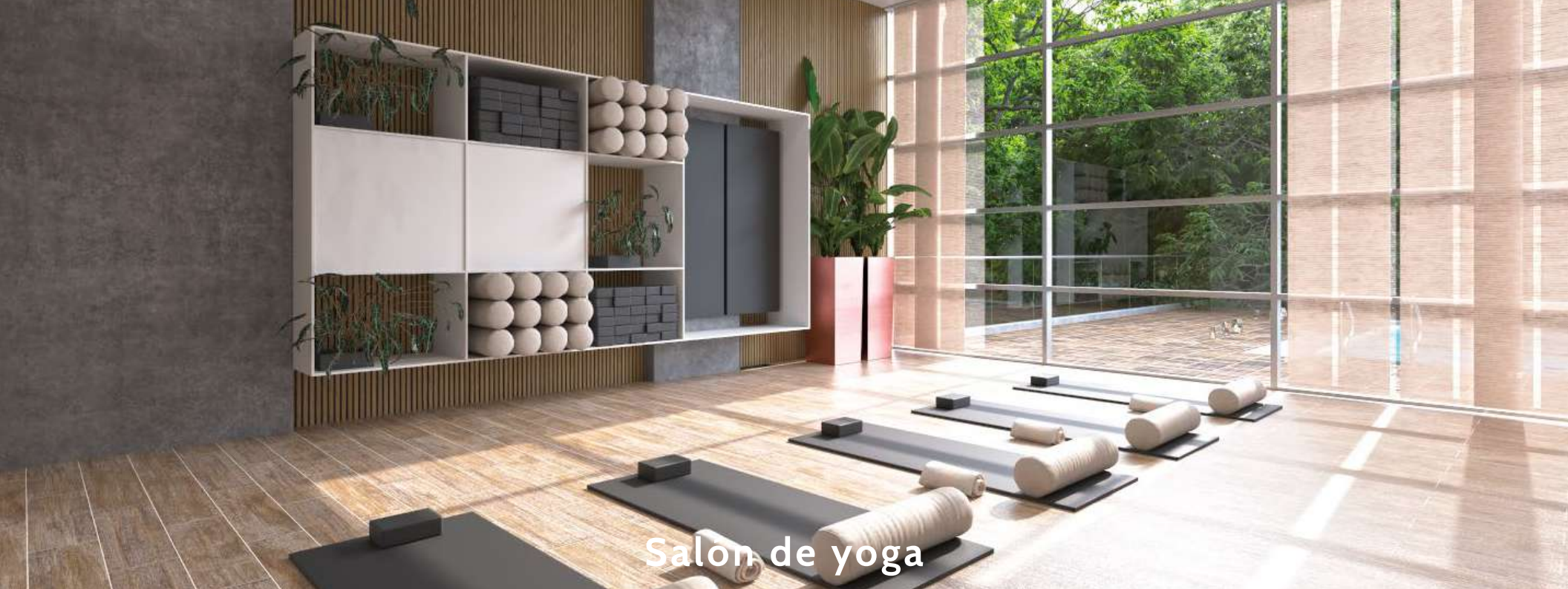
Salón de yoga