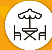
Terraza con chimeneas