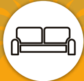
Lobby de acceso