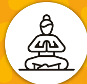
Salón de yoga