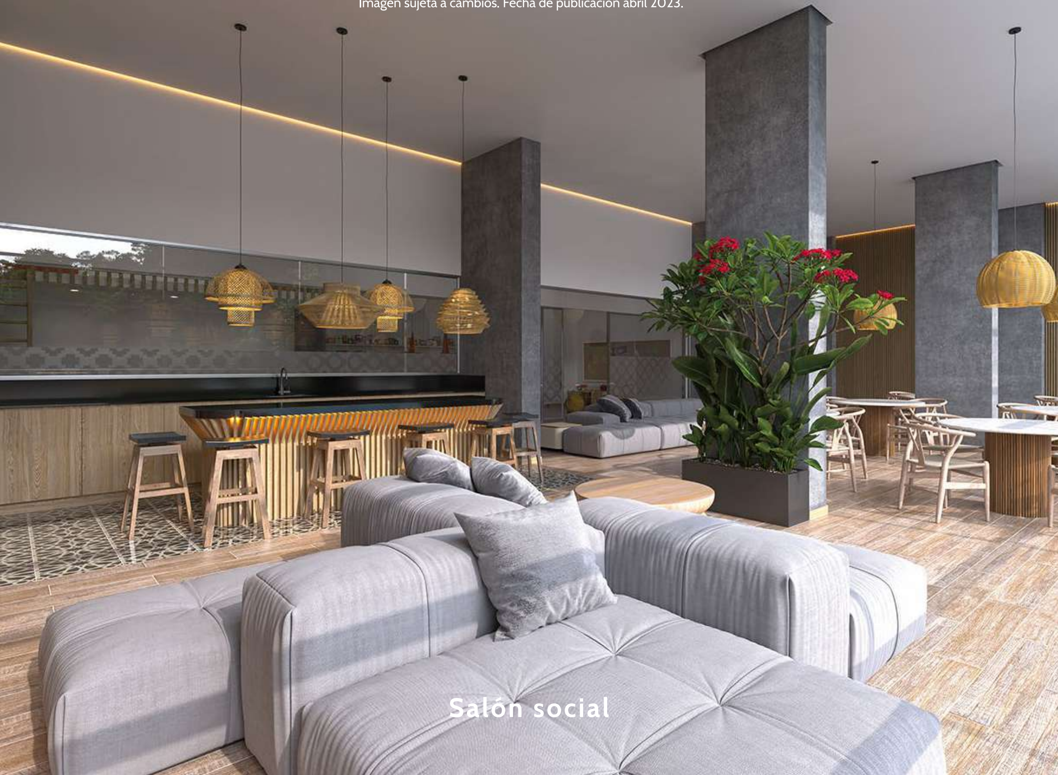
Imagen sujeta a cambios. Fecha de publicación abril 2023.