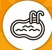
Piscina adultos y niños