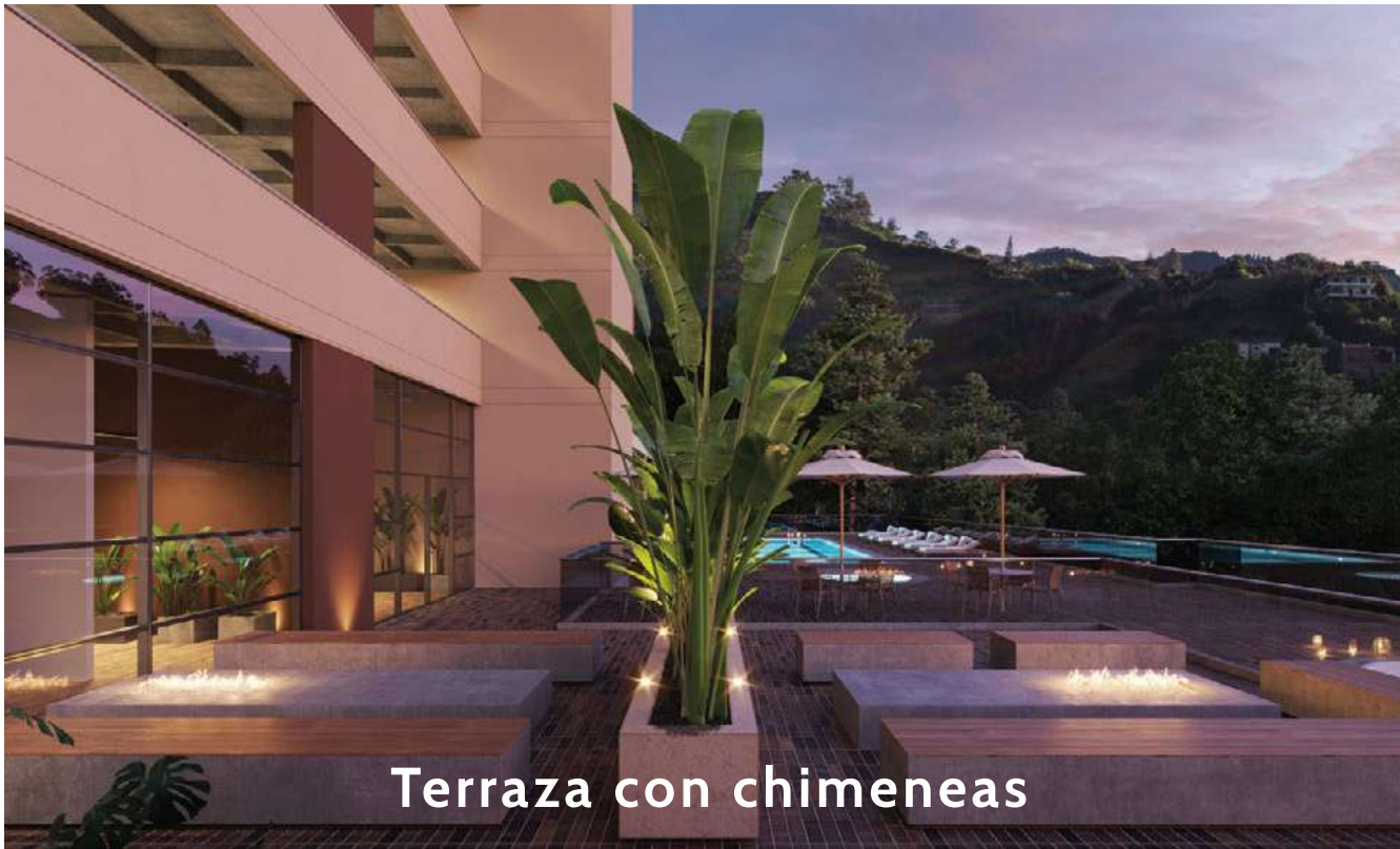
Terraza con chimeneas