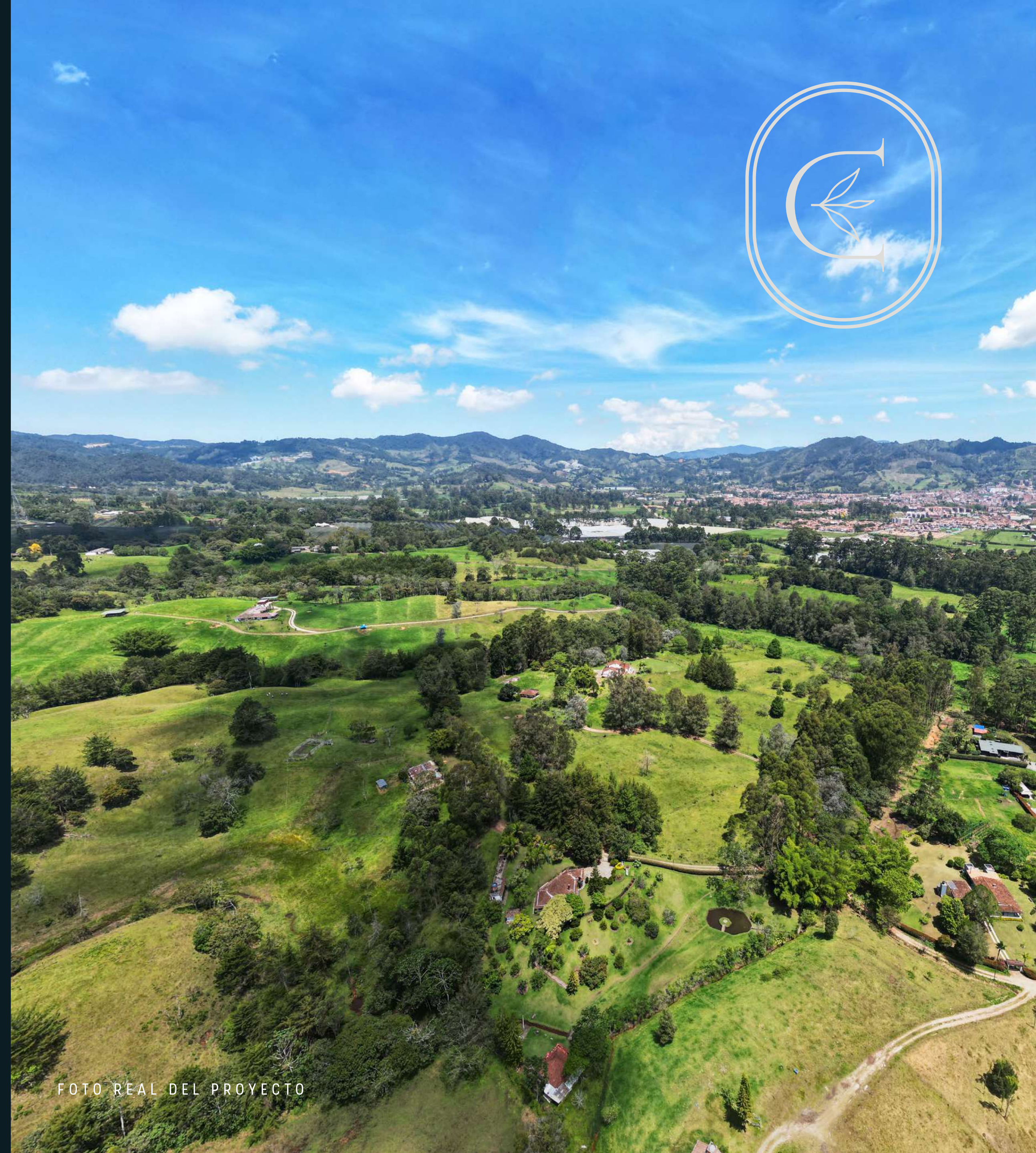
FOTO REAL DEL PROYECTO